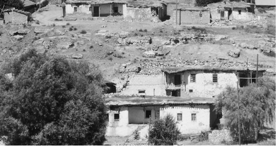
İssız bir Orta Anadolu Köyü

1980 ve 1990'lı yıllar boyunca köylerin yanında kasabalar da büyük nüfus kaybetmiş ve ıssızlaşmıştır. Nuri Bilge Ceylan'ın Kasaba (1997) filminde bu konu işlenmiştir. Üçlemenin diğer iki filminin adı Mayıs Sıkıntısı ve Uzak olması da manidardır.