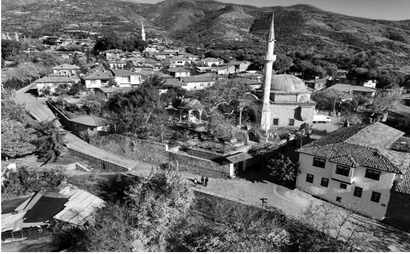
İzmir Ödemiş Birgi Köyü 24

durumu ifade etmektedir: “İç Anadolu veya Karadeniz bölgesine ben geri dönsem, üstelik orali olmama rağmen beni barındırmazlar.” 23 En çok tercih edilen illerin başında Çanakkale, İzmir, Balıkesir, Muğla gelmektedir.