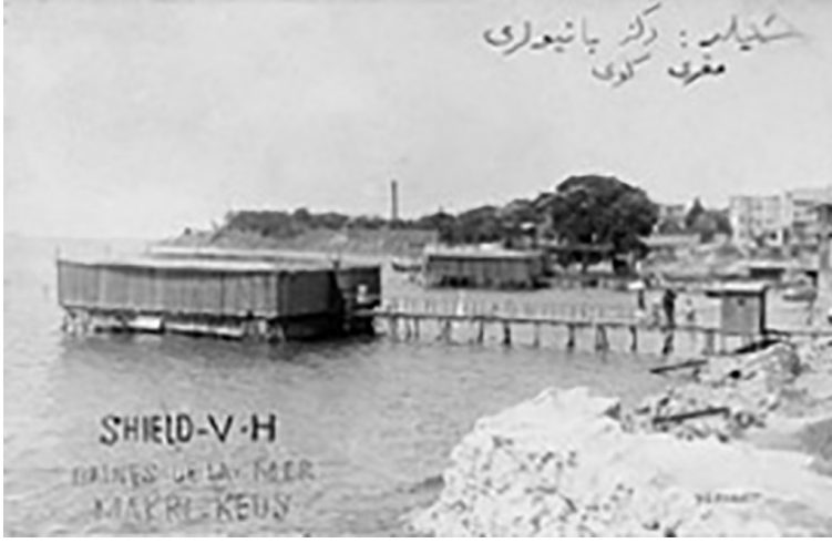
Resim 1: Fenerbahçe Deniz Hamamı

lirlenmiş yapım kodlarının olduğu bilinmektedir. Fikret Adil'in 1941 tarihli gazete yazısında deniz hamamlarından şu şekilde bahsedilmektedir; "Deniz banyoları ahşap panellerden yapılmış kapalı yerlerdi. Yanlarda soyunma yerleri vardı. Sahile iskelelerle bağlanan bu dört köşeli ahşap havuzlar altında ızgara vardı. Suyun en derin kısmı genellikle ızgarayı geçmiyordu. Boğulma tehlikesi yoktu." 13