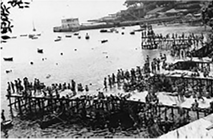
Resim 4: Moda Deniz Hamamı (1960'li yıllar)