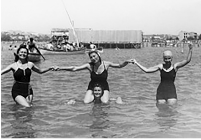
Resim 2: Kalamış Deniz Hamamı (1930'lar)