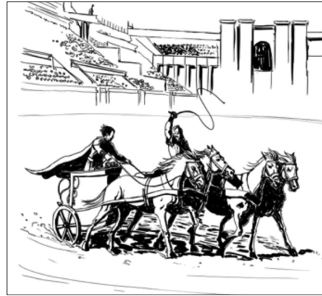
Şekil 1. Hippodrom

• Hippodrom: Roma ve Bizans toplumlarındaki gösteri geleneğini bilenler; bu tür gösteri ve yarışmaların yapıldığı Hipodromun söz konusu imparatorluk yönetimi için ne kadar önem taşıdığını da bilirler. Halkın forme edildiği ve siyasal ajitasyonla sevk ve idare edildiği bu mekânlarda mimari görkem ve etkileycilik ön plana çıkmaktadır. Romanda bu mimari mekânlar ayrıntılı bir şekilde tasvir edilmiştir. Konstantinopolis limanlarından halkın protokol yoluyla, coşkuyla hipodroma akması ve şatafatlı törenler için kuşamlı muhafızların, atlı savaş arabalı